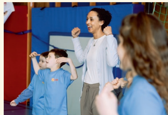
Malaika Mihambo beim Auftakt von KILANA – Kinderleichtathletik und Nachhaltigkeit.