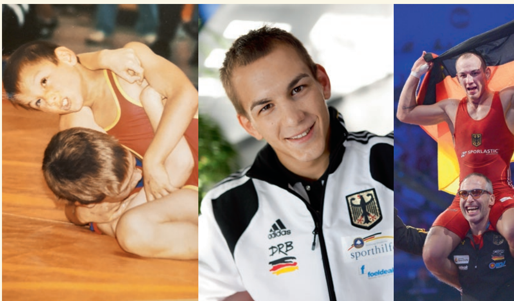
Stationen der Karriere von Ringer Frank Stäbler: vom vielfachen Deutschen Jugendmeister zu drei WM-Goldmedaillen und Olympia-Bronze 2021. Als Keynote-Speaker gibt er jetzt seine Erfahrungen aus 25 Jahren Leistungssport weiter.

Drei Schlüsselindikatoren wurden für die Organisation des Sports ermittelt. Erstens, Förderkonzepte und organisationale Förderprogramme für Athleten. Diese Förderkonzepte sollten athletenzentriert, langfristig und ganzheitlich ausgelegt sein und Athleten und Trainer in die Karriereplanung und -entwicklung einbinden. Dabei spielen auch Karriereentwicklungspläne und die Koordination von Sport und Schule sowie unterstützende Gesundheitsprogramme eine wichtige Rolle. Zweitens, sind die Kultur, die Struktur und die Ressourcen der