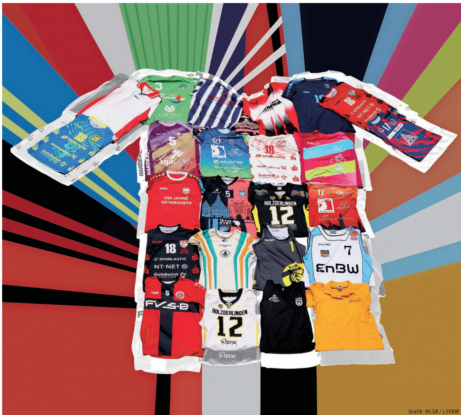
Grafik: WLSB / LSVBW