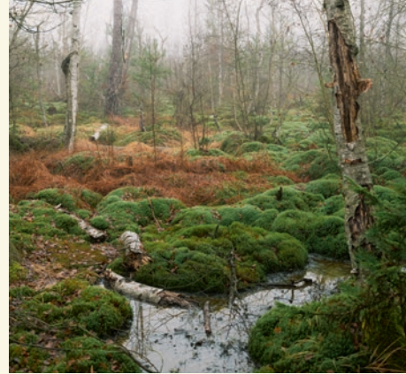
Ein Moor wie dieses wird mit den Spenden des organisierten Sports renaturiert.

Klimaschutzstiftung Baden-Württemberg IBAN DE95 6005 0101 0004 4247 47 BIC/SWIFT SOLADEST600