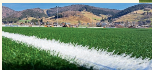
Neuer Kunstrasenplatz für den FC Bernau.