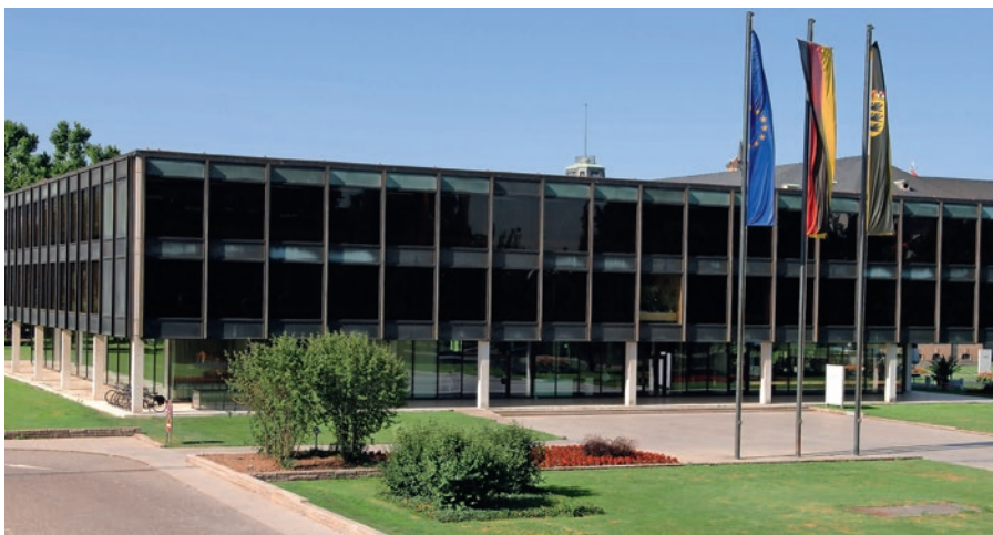
Mit der Politik in Baden-Württemberg hat der LSVBW in Corona-Zeiten vertrauensvoll zusammengearbeitet.

Elvira Menzer-Haasis Präsidentin des Landessportverbandes Baden-Württemberg e.V.