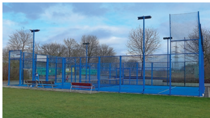
Der Padel-Court des TC Pleidelsheim war bereits Austragungsort eines Turniers der German Padel Tour.