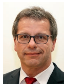
Andreas Felchle Präsident des Württembergischen Landessportbundes