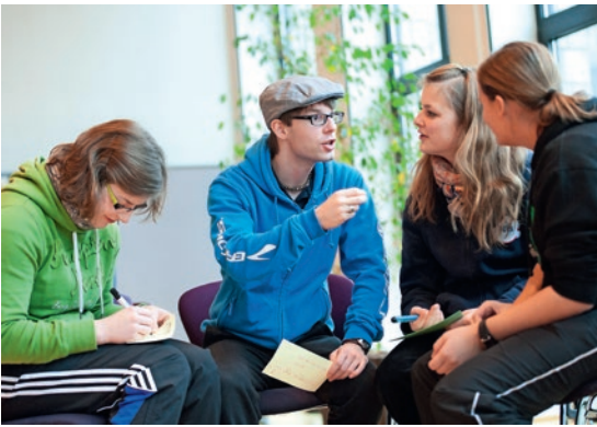
Jugendliche wollen mitreden, sind aber auch bereit, Verantwortung zu übernehmen.