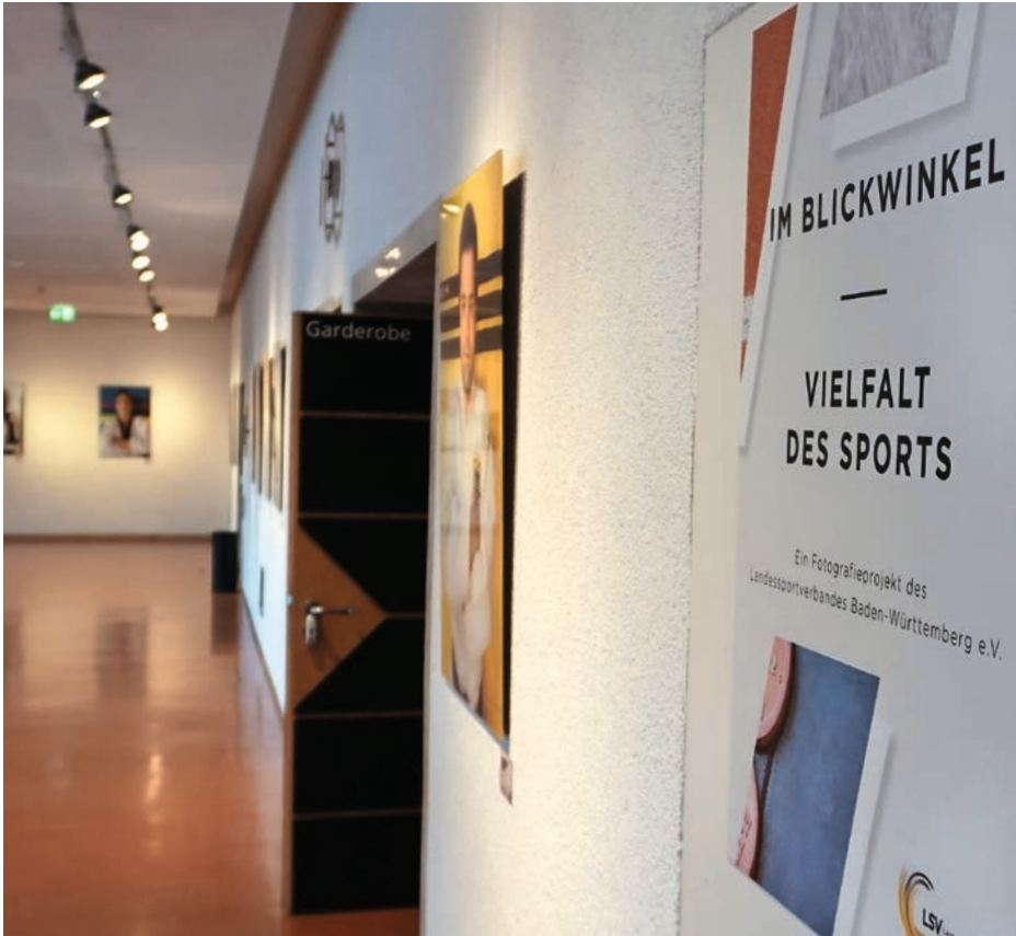
Auf großen Zuspruch stieß die Fotoausstellung des LSV im Stuttgarter Rathaus.

Wanderausstellung des LSV war zuletzt im Stuttgarter Rathaus zu sehen