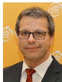
Andreas Felchle Präsident des Württembergischen Landessportbundes