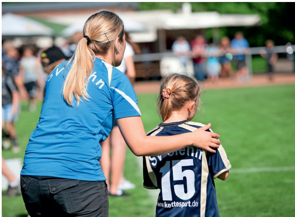
Dass Frauen im sportlichen Bereich der Vereine allseits aktiv sind ist nichts Neues ...

Wir, das heißt der Ausschuss Frauen und Gleichstellung im Sport des LSV, arbeiten sehr gut zusammen und sehen Chancen, die es zu nutzen gilt. Wir haben inzwischen ein Netzwerk aufgebaut, das sehr hilfreich ist, um Frauen für das Ehrenamt zu gewinnen und sie zu begleiten. Ein Grund für meine erneute Kandidatur ist auch, dass ich glaube, dass eine gewisse Kontinuität gut ist.