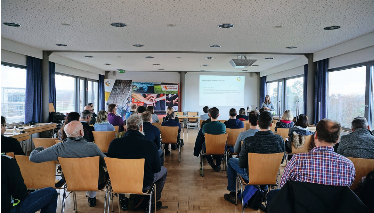
Sechs Info-Foren finden in diesem Zyklus statt.

Im Rahmen der Freiwilligendienste im Sport richtete die Baden-Württembergische Sportjugend (BWSJ) wieder die bewährten Veranstaltungen für Einsatzstellen aus