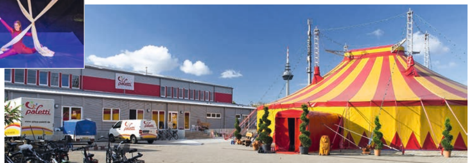
Das neue Trainingszentrum des Zirkus Paletti in Mannheim.