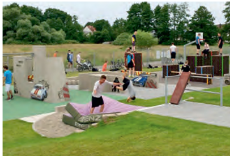
Die neue Parkouranlage der TG Ötigheim

Die Turngemeinde Ötigheim (TGÖ) hat vor rund fünf Jahren das Thema Parkour in sein Sportprogramm aufgenommen. Grund dafür war der Rückgang von jugendlichen Mitgliedern, speziell in den klassischen Turnerguppen. Mit Parkour erlebte die TGÖ