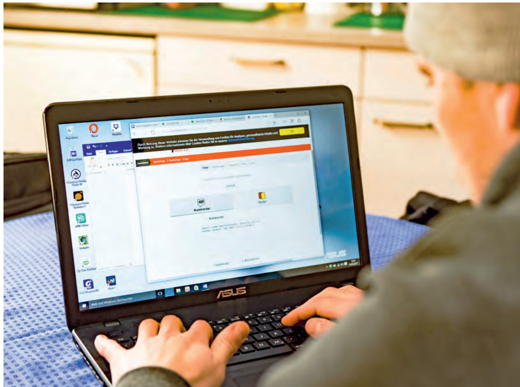
Die Leistungssport-Datenbank des LSV kann überall und von allen befugten Personen benutzt werden