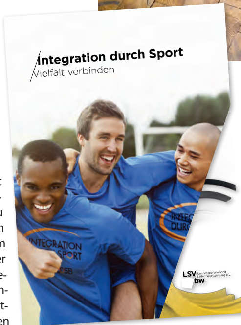
Zwei Beispiele von vielen aus der anschaulichen Broschüre des LSV

Unterstützungsmöglichkeiten interessierten Vereinen mit Rat und Tat zur Seite. Dass es sich lohnt, sich mit den Themen Integration und interkulturelle Öffnung zu befassen, belegen positive und gelungene Praxisbeispiele aus dem Vereinsalltag. Die Broschüre richtet sich an eine breite Zielgruppe und soll eine erste Kontaktaufnahme zu allen Interessierten ermöglichen, ebenso wie zur Ansprache und Information potenzieller Kooperationspartner dienen. ■