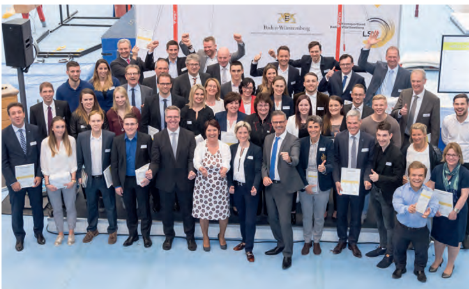
Ehrende und Geehrte

In einer lockeren Talkrunde unter dem Motto „Leistung im Sport – Leistung im Beruf – Chancen der Leistungssportreform“, welche von Michael Antwerpes moderiert wurde, äußerten sich die Ministerin, die LSV-Präsidentin und der Direktor Leistungssport des DOSB insbesondere zu den Vorteilen der dualen Karriere. Was die Initiative „Partnerbetriebe des Spitzensports“ anbetrifft, zeigte sich Wirtschaftsministerin Dr. Hoffmeister-Kraut über deren Entwicklung hoch erfreut: „Das liegt daran, dass wir viele Partner