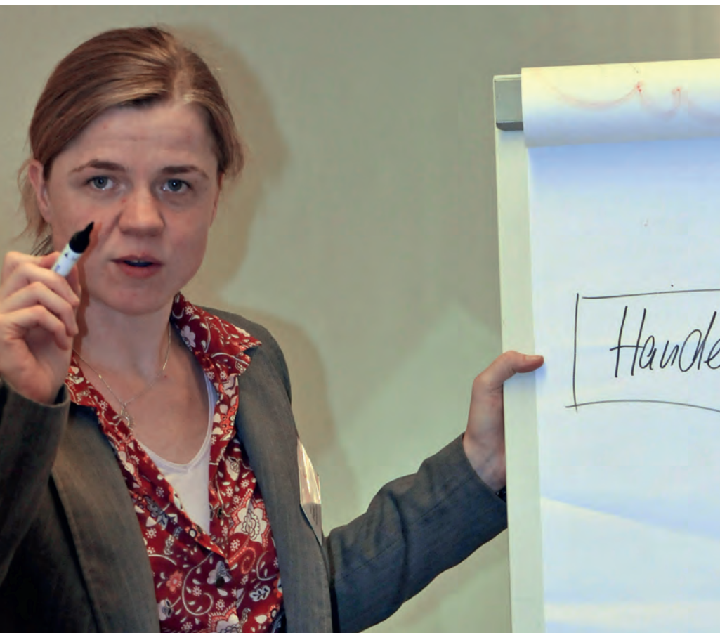
Frauen zur Übernahme von Führungspositionen im Sport zu bewegen ist die Aufgabe des LSV-Ausschusses

Der Sport im Verein wird älter, internationaler und weiblicher: Was gehört dazu, dass noch mehr Vereine Frauen zu