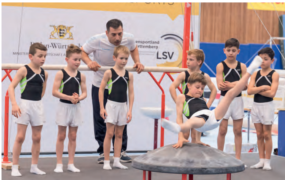
Nachwuchsturner der Vereine MTV Stuttgart, TSV Schmiden und SV Neustetten